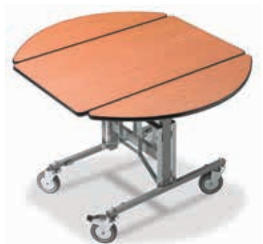
RST.3003 Doppel-D Tischplatte mit schwarzer PVC-Kante L: 94 cm B: 107 cm H: 76 cm B: 57 cm (geklappt)