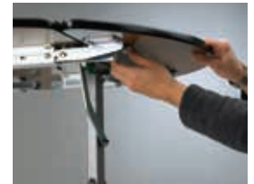
Riegel herausziehen und feststellen