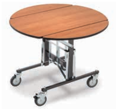
RST.3001 Runde Tischplatte mit polytexturierter Kante L: 100 cm B: 100 cm H: 76 cm B: 57 cm (geklappt)