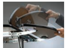
Tischplatte hochklappen und in vertikaler Position feststellen