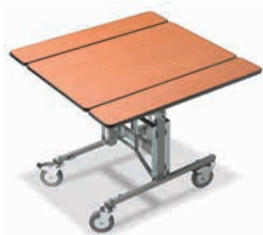
RST.3002 Quadratische Tischplatte mit schwarzer PVC-Kante L: 91,5 cm B: 91,5 cm H: 76 cm B: 57 cm (geklappt)