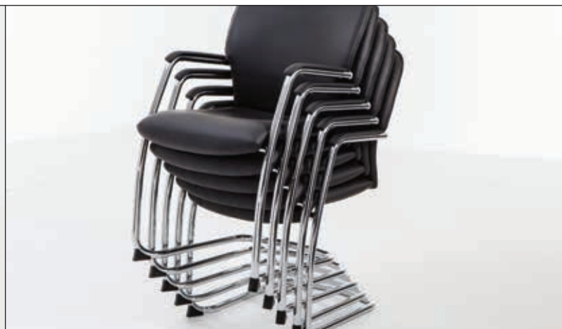
Lässt sich je nach Modell bis zu 5 Stühle hoch stapeln (nur Freischwinger-Modelle)