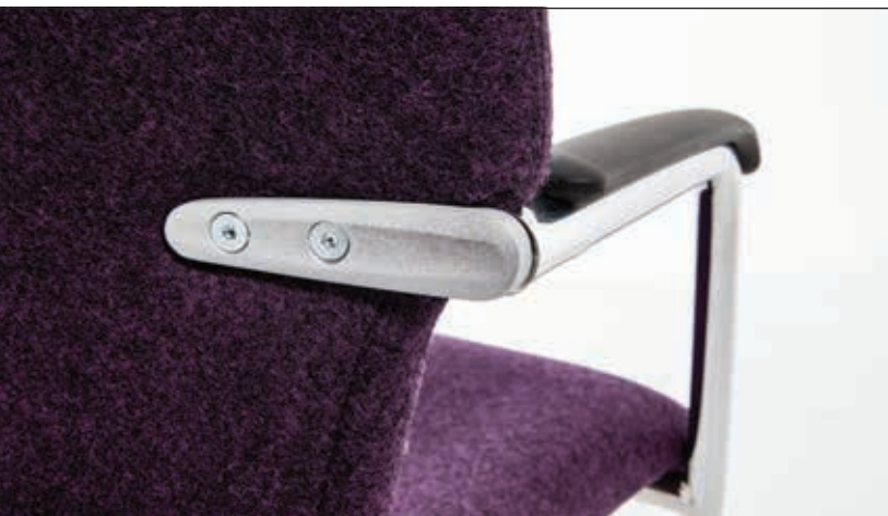
Verbindungselement bei den Modellen 37/6-9 mit silberner Strukturlackierung als Kontrast zum Rahmen