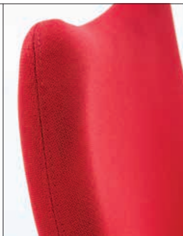
Stoffpolsterung mit abgerundeter Steppnaht