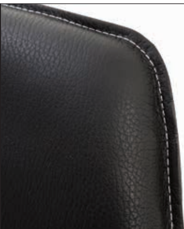
Ziernaht nur bei den Modellen 37/6-9 in Leder

Tiefe 67,5 cm Gewicht 10,3 kg Nicht stapelbar