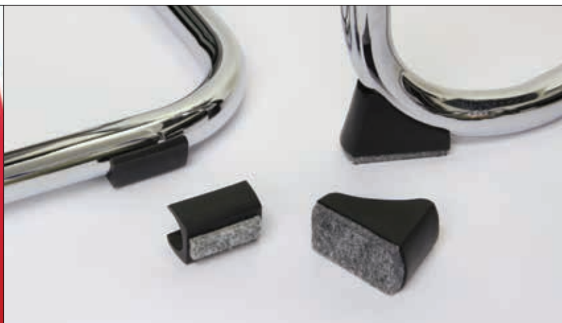
Optional - Filzgleiter zur Lärmdämmung und zum Schutz von Parkett, Laminat und Fliesen