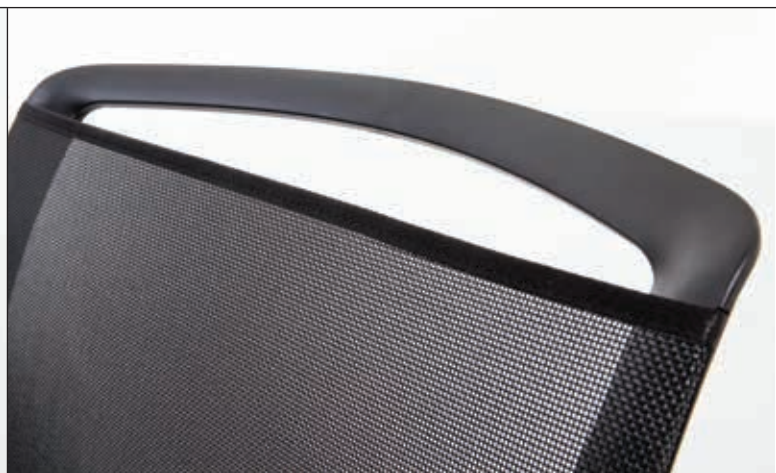
Modelle 37/18 und 37/19 mit atmungsaktivem Netzstoff Rahmen der Rückenlehne mit Griff für eine einfache Handhabung