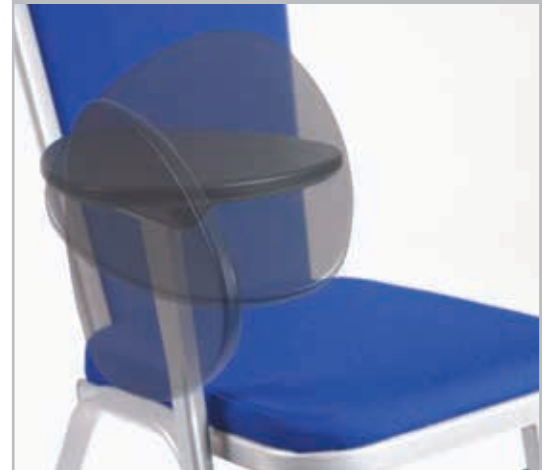
Zubehör – abnehmbare Schreibplatte