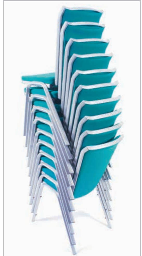
Der Stuhl lässt sich 12 Stühle hoch stapeln (besuchen sie unsere Webseite für weitere Informationen zu unserem speziell entwickelten Stapelwagen)