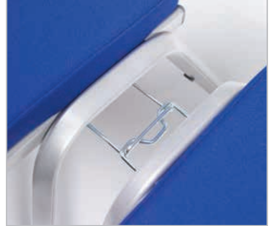
Option- einschiebbare Verkettung